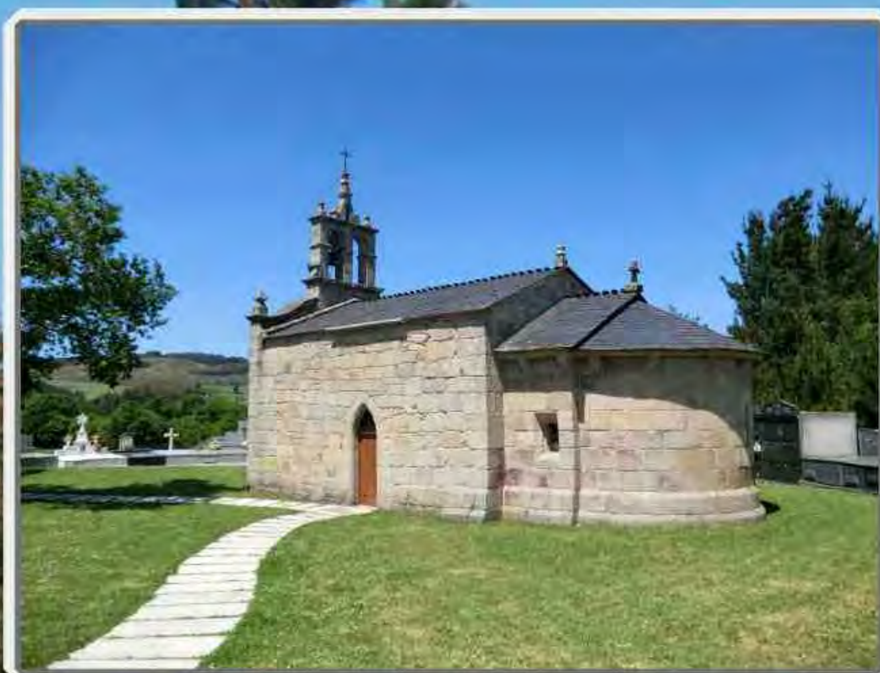
Igrexa de Francos

Esta ruta, en combinación coas outras catro da Mancomunidade da Terra Chá, perminten gozar da contorna das terras lucenses.