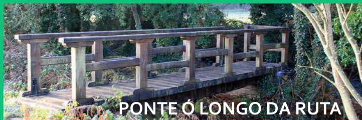
PONTE Ó LONGO DA RUTA

Seguiremos descendendo ata chegar ó final da ruta no conxunto histórico de Castro de Rei, que aproveitaremos para visitar.