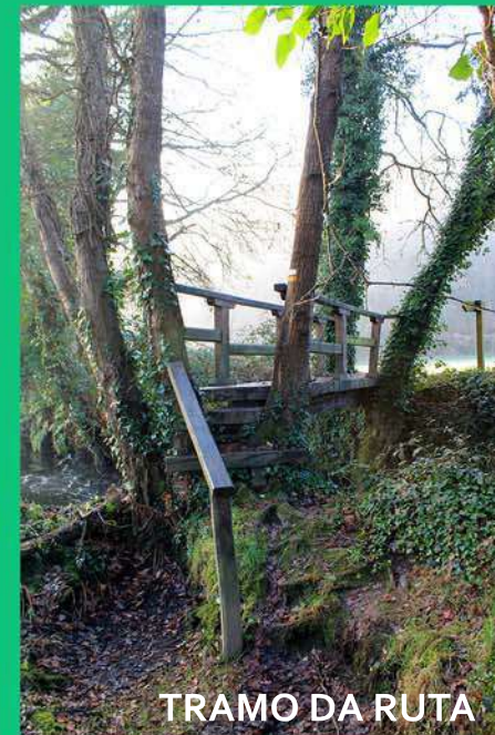
TRAMO DA RUTA

Los municipios de Castro de Rei y Outeiro de Rei forman parte íntegramente de la "Reserva de la Biosfera Terras do Miño". La especial conservación de estos espacios, el equilibrio entre la conservación del patrimonio cultural y natural, su uso de manera sostenible en el tiempo y la especial convivencia entre el hombre y la naturaleza hizo de esta zona merecedora de este reconocimiento por parte de la UNESCO.