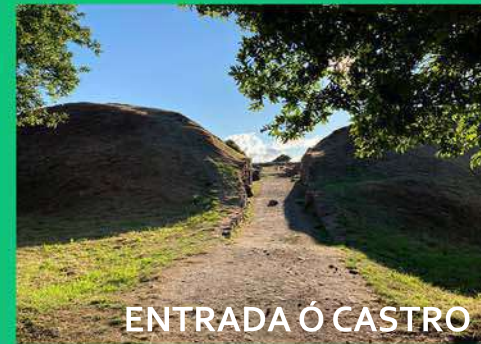
ENTRADA Ó CASTRO