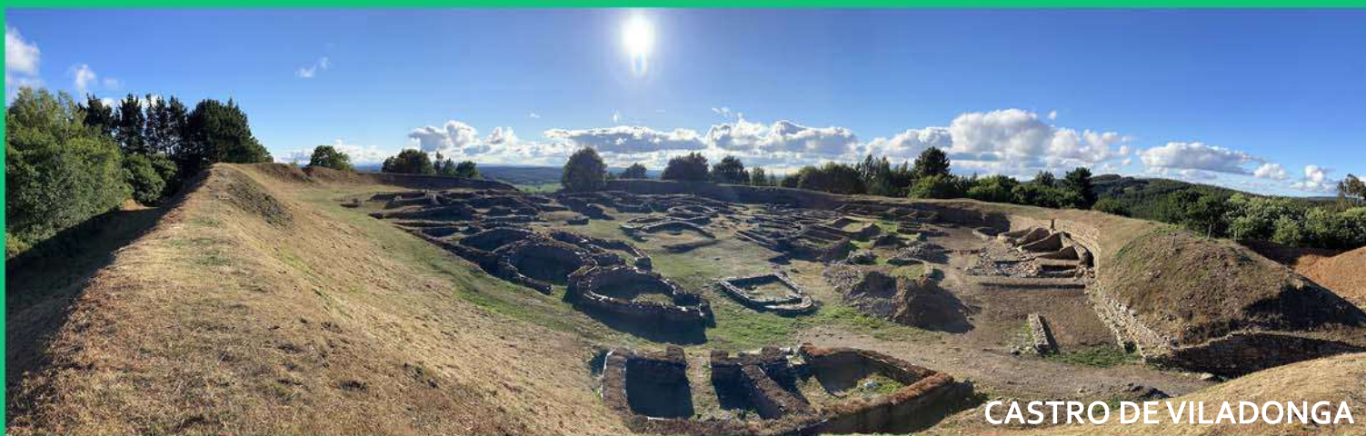
CASTRO DE VILADONGA

En el siglo XVI fue levantado el castillo de Castro de Rei, que le dio nombre, blasón y escudo a la villa. El castillo, que con el núcleo de población, estuvo rodeado de murallas, se conservó en pie hasta 1941, año en el que desapareció. El alto en el que se encuentra el núcleo primitivo de la villa fue un castro rodeado por los ríos Azúmara y Torneiros, conserva restos de las antiguas defensas y de la fortaleza. En el año 1971 fue declarado conjunto histórico y paraje pintoresca.