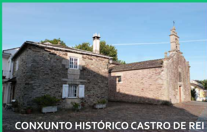
CONXUNTO HISTÓRICO CASTRO DE REI

No século XVI foi erguido o castelo de Castro de Rei, que lle deu nome, brasón e escudo á vila. O castelo, que co núcleo de poboación, estivo rodeado de murallas, conservouse en pé ata 1941, ano no que desapareceu. O alto no que se encontra o núcleo primitivo da vila foi un castro rodeado polos ríos Azúmara e Torneiros, conserva restos das antigas defensas e da fortaleza. No ano 1971 foi declarado conxunto histórico e paraxe pintoresca.