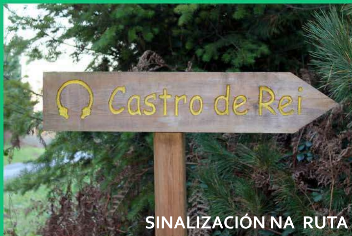
SINALIZACIÓN NA RUTA

Senda lineal que se recorre máis facilmente empezando desde el Museo Arqueológico del Castro de Viladonga, ocasión que debe ser aprovechada para visitar una de las referencias de la vida castreña en Galicia. Desde aquí, descenderemos gozando de una espectacular panorámica de A Terra Chá, del Valle de Francos y de la Sierra de Meira; poco a poco llegaremos hasta el lugar de Monelos, donde contemplaremos un espectacular conjunto de arquitectura civil compuesto por el Pazo de Fontexón, la casa anexa y el molino. Sin olvidar, a escasos metros de la ruta, la iglesia de San Juan de Azúmara.