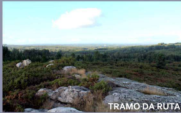
TRAMO DA RUTA

Pasaremos tamén a carón dun xacemento romano, onde parece ser houbo un asentamento dunha pequena vila romana e onde se atoparon restos de cerámica de construción.